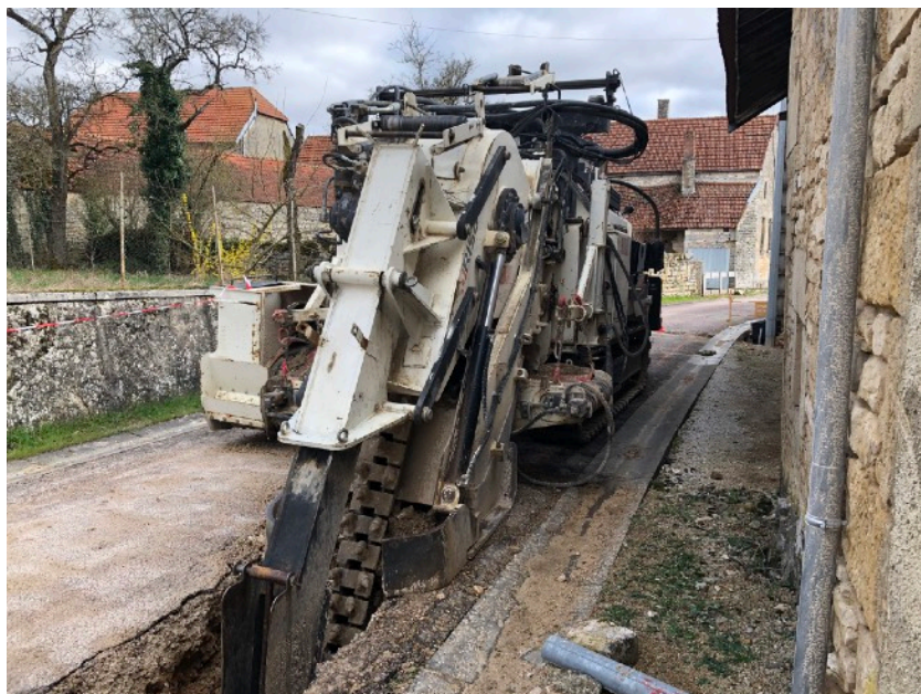
Tranchée au travail...

Le conseil prend connaissance du déroulement des travaux d'enfouissement.