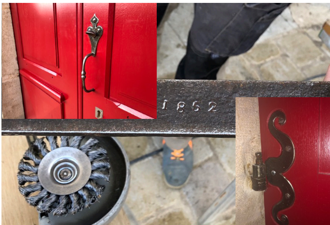
Détail des ferrures anciennes réutilisées pour les nouvelles portes de l'Église

Le Conseil a pris position sur la finition à donner aux ferrures de la porte de l'Eglise.