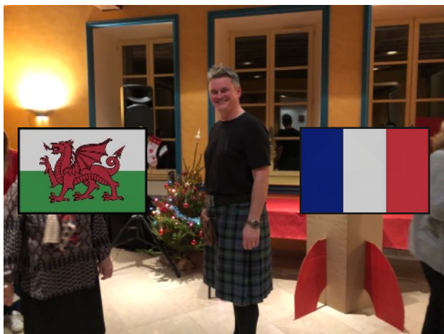
Le plus Français des Gallois arborant fièrement le tartan familial de sa femme!