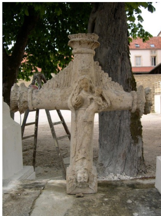
Coté Vierge Marie

A ce jour, la restauration est terminée et le calvaire sera remis en place courant 2020