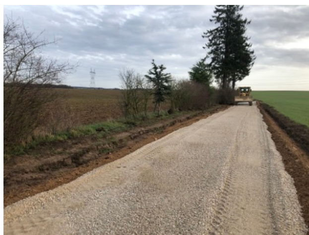
Purge du chemin de la voie d'Aisey