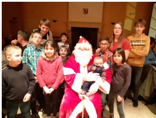
Le père Noël entouré des enfants...