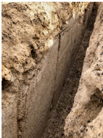
Tranchée en pleine roche!