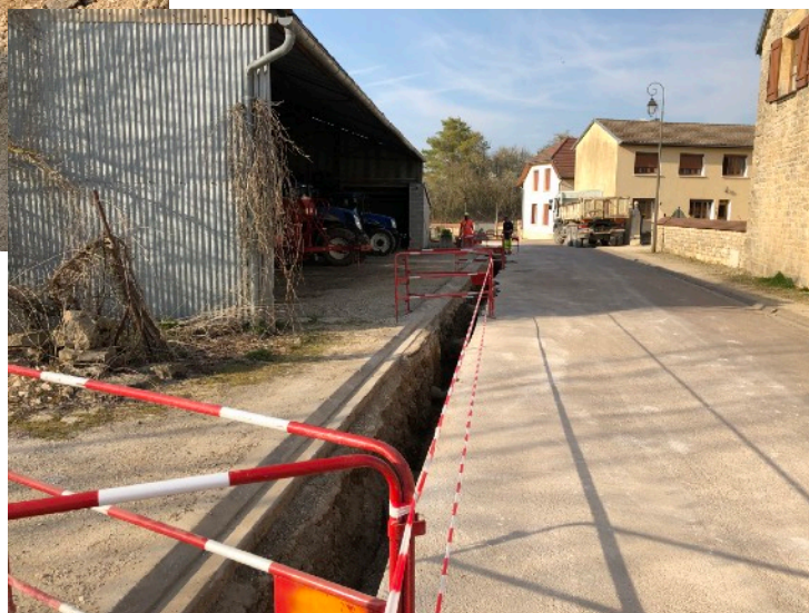
Travaux d'enfouissement de la ligne moyenne tension Savoisy - Puits - Coulmier Mars - Avril 2019