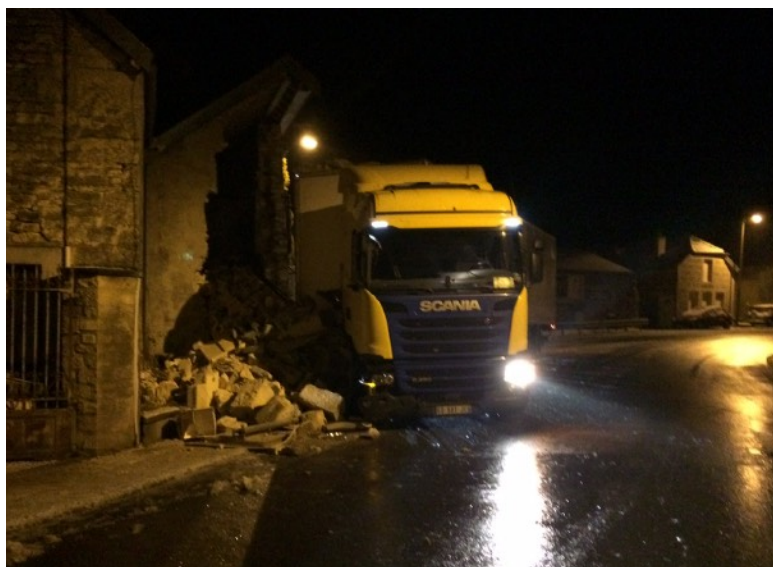
Accident du 29 Janvier vers 1h 30, la rue de Bussy recouverte de glace!

Suite à l'accident du 29 janvier sur le Cd 980 / Rue du Four le conseil entame une réflexion sur les aménagements susceptibles de protéger les biens et les personnes sur ce point propice aux accidents.